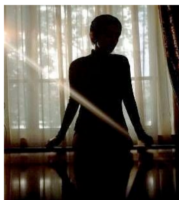
Indagine Cenispes: sono raddoppiati nel primo semestre